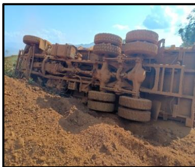
Gambar 4.4 Dumphtruck yang terperosok akibat jalan yang bergelombang dan berlubang ketika diguyur hujan.

Pada tahap ini dilakukan pengangkutan material ore , dimana material tersebut dibawa menjadi langsung dibawa oleh dumprtruck untuk kemudian langsung dibawa ke jetty . Dari urutan kerja tersebut terdapat potensi bahaya dimana saat musim penghujan dapat mengakibatkan kondisi jalan yang basah dan licin, sedangkan pada musim panas kondisi jalan jadi berdebu dan rawan selip, sehingga dapat mengganggu proses produksi (lihat Tabel 4.4).