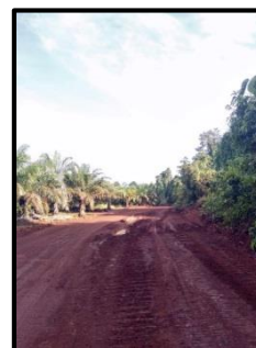
Gambar 4.2 Kondisi Jalan Angkut Lokasi Penelitian

Jarak dari Pit ke Jetty adalah 2.29 km dengan alat angkut Dumpttruck jenis Hino FM 260 JD. Dengan kondisi jalan angkut di PT. Jaya Bersama Sahabat (Gambar 4.2) banyak sekali resiko kecelakaan yang bisa terjadi di jalan angkut. Baik yang diakibatkan oleh Unsafe Action maupun Unsafe Condition yang dapat berpengaruh terhadap keselamatan maupun kesehatan para pekerjanya.