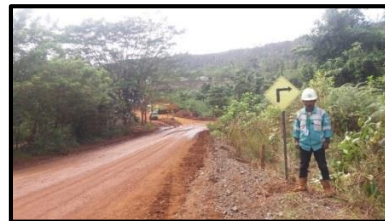
Gambar 4.3 Rambu-rambu K3

Berikut adalah rambu tindakan keselamatan kerja berupa rambu peringatan di PT. Jaya Bersama Sahabat (lihat Gambar 4.3)