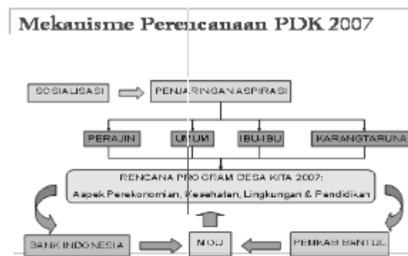
Gambar 2 Model Proses Perencanaan Program CSR Desa Kita

Kebutuhan seluruh warga masyarakat berdasarkan empat aspek dimaksud yang digolongkan menjadi proyek fisik dan non-fisik kemudian diinformasikan dan didiskusikan dengan Bupati Bantul dan jajarannya. Dari hasil diskusi dapat dipilah-pilah proyek apa saja yang bisa dipenuhi oleh Anggaran Pendapatan Belanja Daerah (APBD) Kabupaten Bantul dan yang diperlukan bantuan dari BI. PDK Manding diawali dengan penandatanganan Memory of Understanding (MoU) antara Pemimpin BI Yogyakarta, Djarot Sumartono, dengan Bupati Bantul, HM Idham Samawi, yang disaksikan oleh Direktur Perencanaan Strategis dan Hubungan Masyarakat, Budi Mulya, pada tanggal 11 Desember 2006.