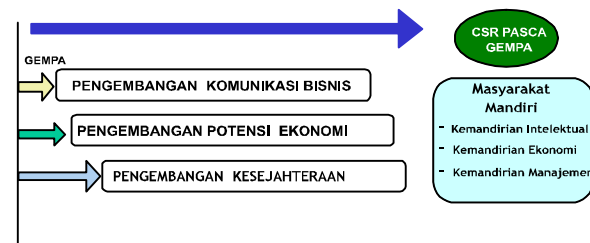
Gambar 1. Tujuan CSR Jangka Panjang Yang Ingin Dicapai Komunikasi Perusahaan, Pemerintah, & Masyarakat