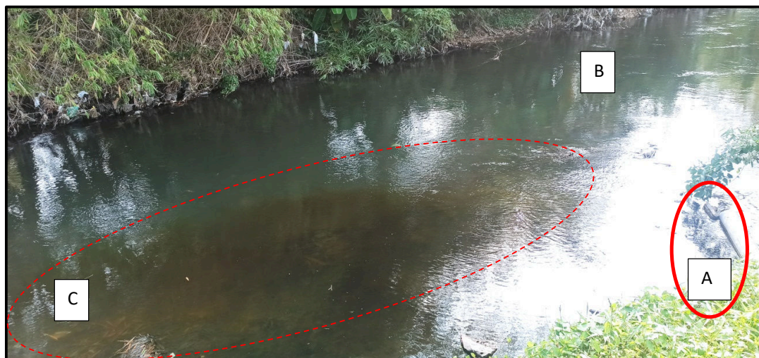
Gambar 1. Anak Kali Bedog terdampak Vinasse

kehitaman, bau menyengat, dan memiliki kandungan bahan organik yang sangat tinggi (Soeprijanto dkk., 2010).